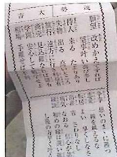
大吉でした、ヤッター！

新年のご挨拶 新年をむかえ、この一年 が皆様の光り輝く素晴らし い年になりますように心か ら願っております。 私も松尾板金も昨年以 上の技術の向上と、サ の提供を誓い合い、頑張 でき締める思いで頑張る所 存です。 新年のご挨拶 新年をむかえ、この一年 が皆様の光り輝く素晴らし い年になりますように心か ら願っております。