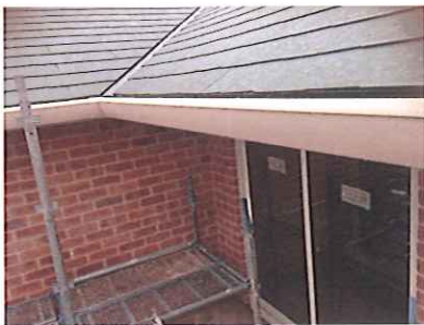
①丸い樋や角ばった樋など 色々種類があります