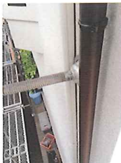
⑤たて樋を取り付けて、 完成です