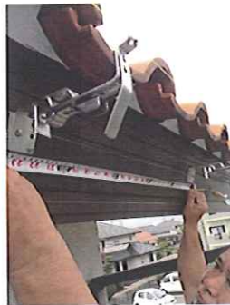
②水の通りを計算しながら 金物を設置していきます