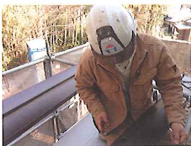
④水の落とし口を鋏で切り 抜きします