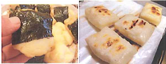
正月といえば、お餅ですね♪

新年のご挨拶 新年をむかえ、この一年 が皆様の光り輝く素晴らし い年になりますように心か ら願っております。 私も松尾板金も昨年以 上の技術の向上と、サ の提供を誓い合い、頑張 でき締める思いで頑張る所 存です。