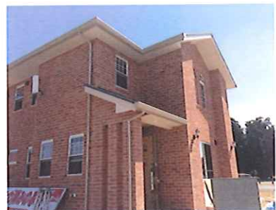
⑥完成全体図です。 樋が建物になじんでますね。

樋かけの流れはこのような感じです。 写真だけ見れば簡単そうにみえますが、計算しながら取り付けていかないと雨樋としての役割をなさない為 突き詰めていけば本当に難しい仕事です。