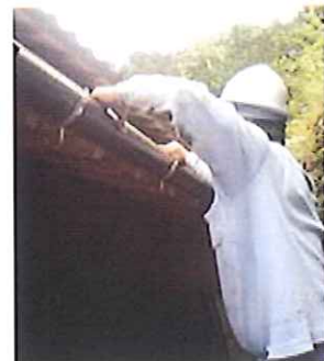
③金物を取付したら軒樋 をかけていきます