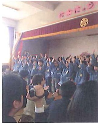
入園式の様子です